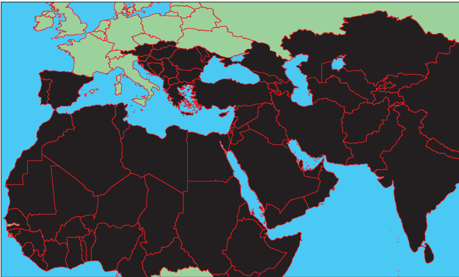
Карта мироустройства ИГИЛ

В настоящий момент группировка контролирует часть территории Сирии, а также ряд провинций в Ираке.