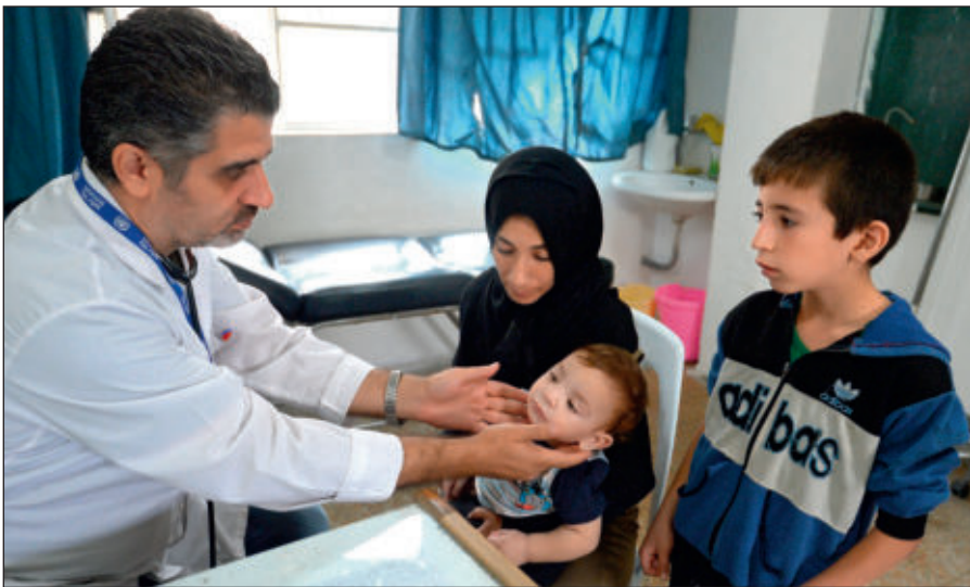
Истинный ислам призывает к состраданию и милосердию. Врач осматривает ребенка в медицинском пункте лагеря при одной из школ Дамаска.

Радикалы объявляют «врагами ислама» всех несогласных с ними мусульман. Ультрарадикальные группировки признают террор и насилие единственным способом достижения провозглашенных ими целей.