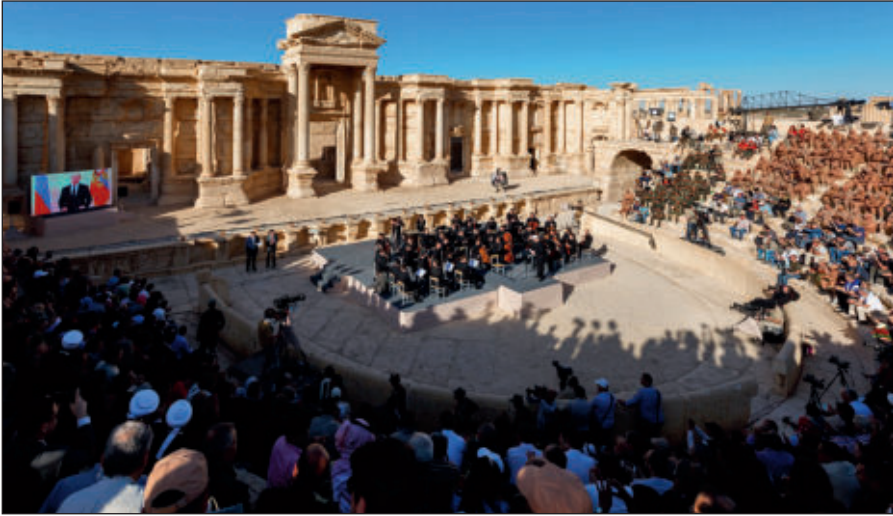
Освобожденная Пальмира. На концерте симфонического оркестра петербургского Мариинского театра под руководством народного артиста России Валерия Гергиева в Римском амфитеатре сирийской Пальмиры, освобожденной от террористов ИГИЛ.