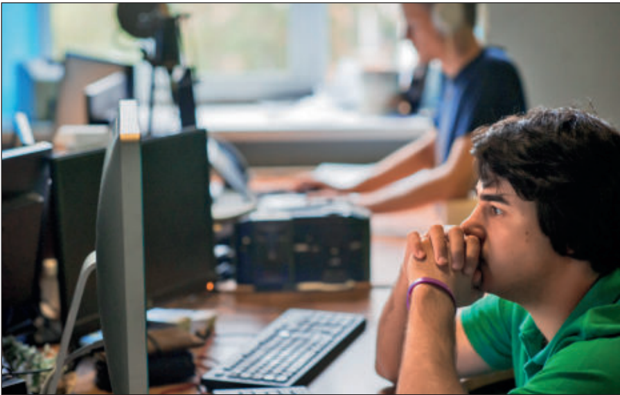
Постоянное присутствие вербовщиков ИГИЛ в соцсетях.

Активисты ИГИЛ поддерживают свои аккаунты в сетях Facebook, Twitter, Instagram, Friendica, Telegram. Активно они заявили о себе и в российских социальных сетях: «ВКонтакте» и «Одноклассниках».