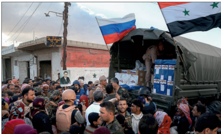
Россия оказывает гуманитарную помощь Сирии.