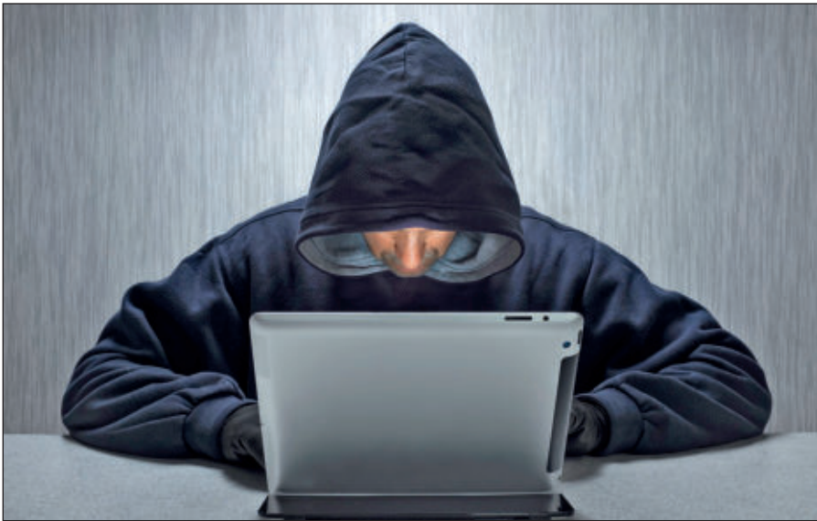
Вербовщики ИГИЛ активно используют Интернет.

Террористы день ото дня совершенствуют методы вербовки новых сторонников, а также алгоритмы их идеологической обработки. Читателю стоит помнить, что те типовые ситуации, которые описаны в данном пособии, можно рассматривать лишь в качестве базовых ориентиров,