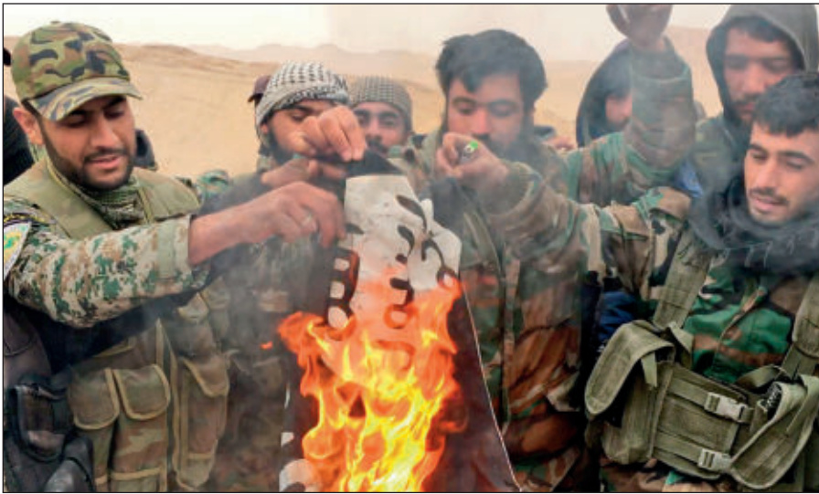
Народные ополченцы САР сжигают флаг ИГИЛ, снятый с отбитой у боевиков цитадели Пальмира.

Современное государство обязано защищать интересы каждого своего гражданина вне зависимости от его расы, национальности, принадлежности к определенной конфессии или религиозной традиции, в то время как ИГИЛ выражает интересы небольшой группы религиозных радикалов, жестоко подавляя остальную часть населения посредством запугивания, насилия и террора.