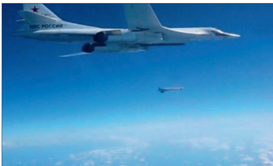
Воздушная операция российских ВКС по уничтожению боевиков ИГИЛ в Сирии.