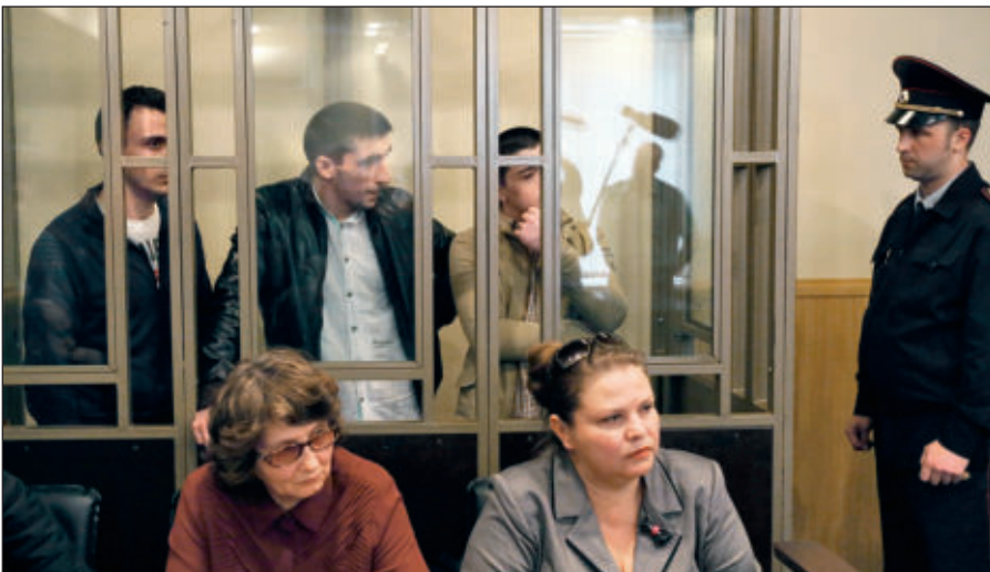
В Российской Федерации предусмотрена административная и уголовная ответственность за пропаганду идей терроризма, участие в деятельности террористических организаций.