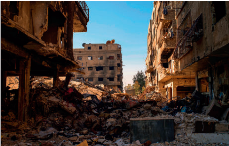
Разрушенный боевиками ИГИЛ Дамаск.

Террористы поставили на поток производство видеороликов с жестокими сценами казней пленников, заложников и «вероотступников». Эти материалы потом широко распространяются в социальных сетях и