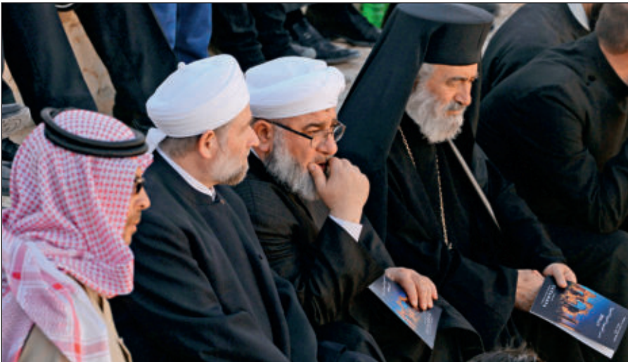
Представители различных конфессий объединились против ИГИЛ. На концерте симфонического оркестра петербургского Мариинского театра в Римском амфитеатре сирийской Пальмиры, освобожденной от террористов ИГИЛ.

В последнее время появилось значительное число верующих, причисляющих себя к крайним религиозным течениям (в СМИ упоминаются как «салафиты», «хариджиты», «ваххабиты»). Однако костяк ИГИЛ составляют лишь люди, причисляющие себя к ультрарадикальному крылу вышеназванных течений.